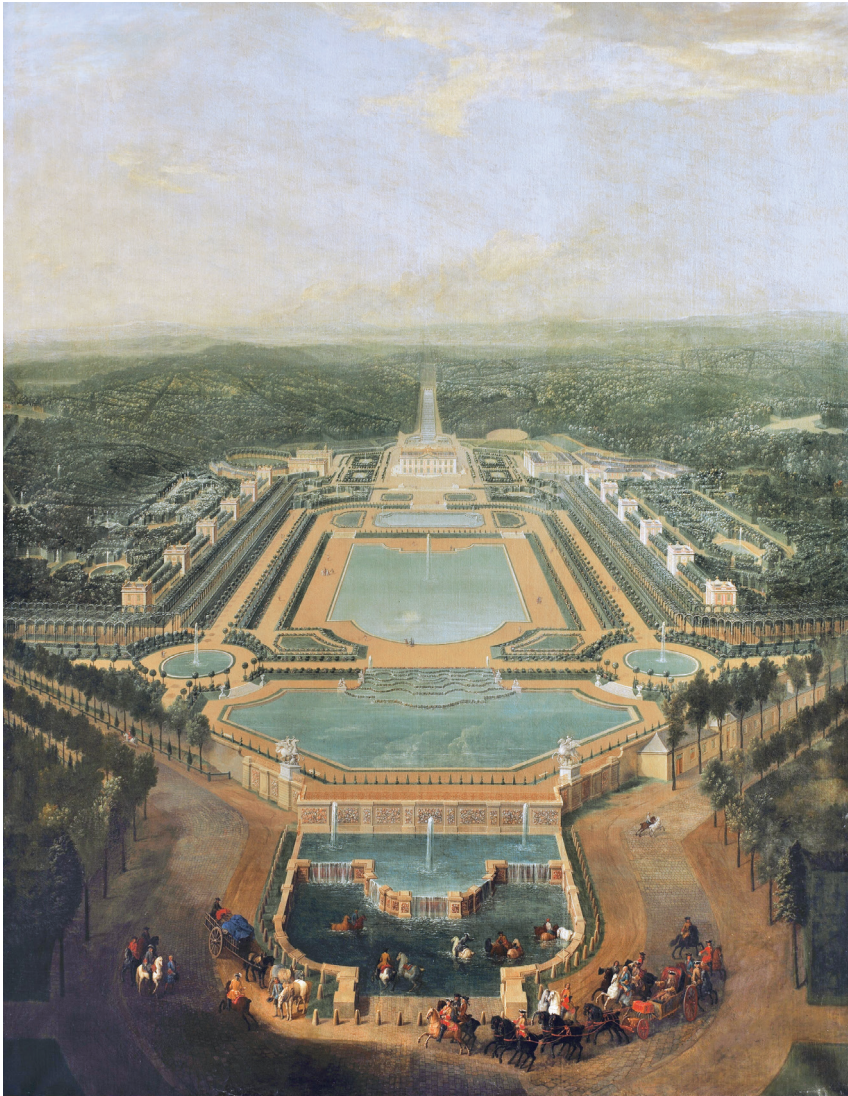
Ил. 135 Марли. Водоем