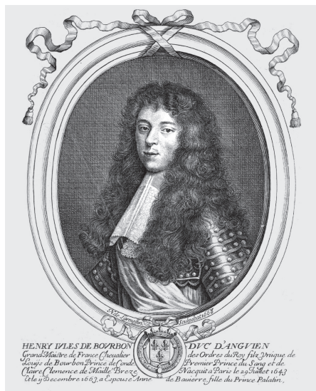
Ил. 5 Анри Жюль де Бурбон, принц де Конде, Месье Принц, в молодости