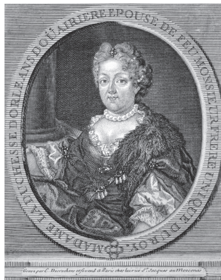
Ил. 4 Елизавета Шарлотта Баварская, герцогиня Орлеанская, Мадам