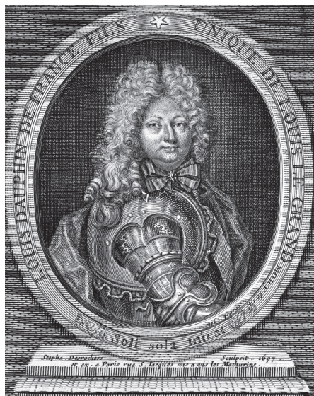
Ил. 3 Людовик Французский, Монсеньор, Великий Дофин