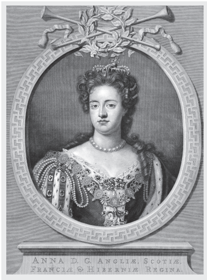
Ил. 97 Анна Стюарт, королева Англии