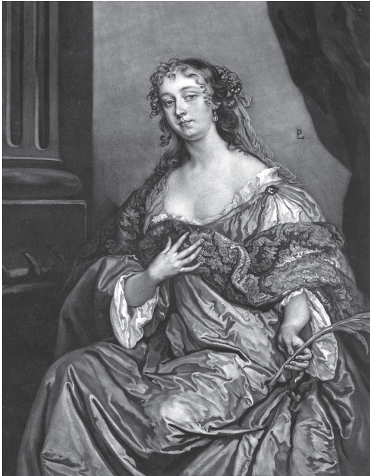
Ил. 59 Элизабет Гамильтон, графиня де Грамон