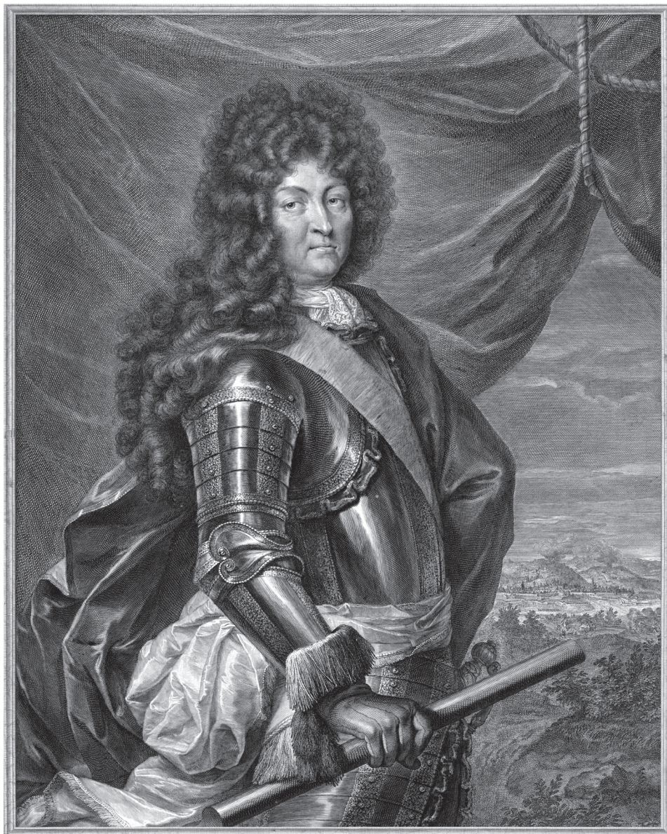
Ил. 1 Людовик XIV, король Франции