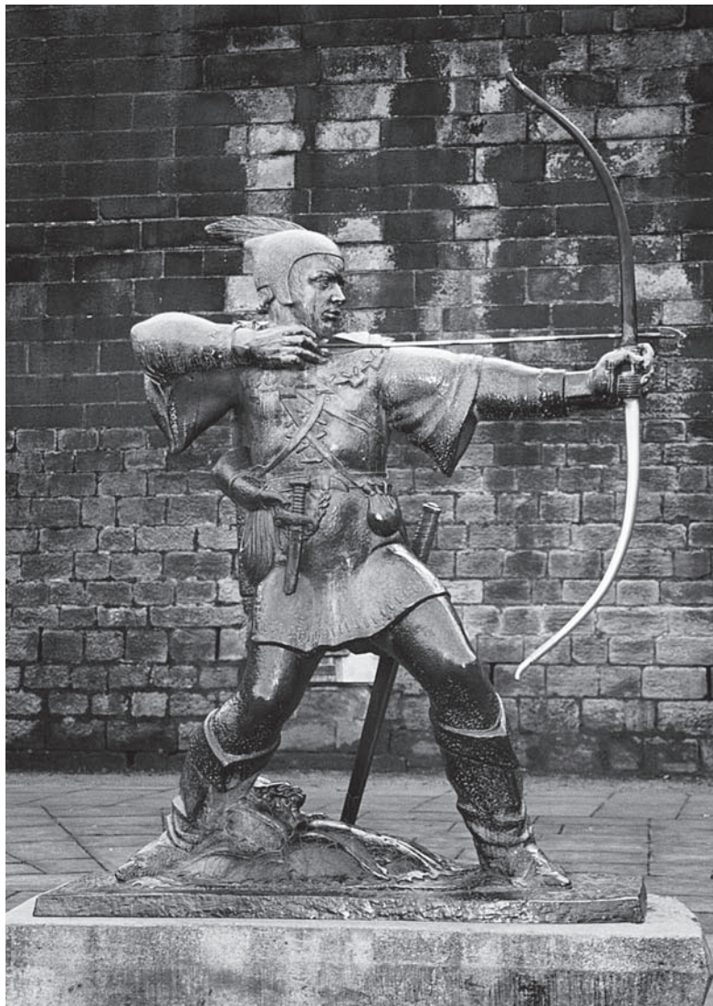
Ил. 37 Памятник Робин Гуду во дворе Ноттингемского замка Скульптор Дж.А. Вудфорд Открыт в 1951 г.