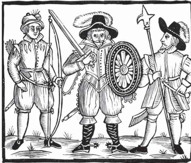
Ил. 13 Робин Гуд, Маленький Джон и Виль Скарлет Худ. не установлен XVII в.