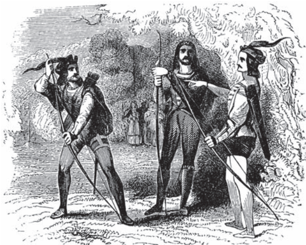
Ил. 25 К балладе «Робин Гуд и Виль Скарлет» Худ. не установлен Ок. 1845 г.