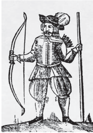
Ил. 11 Робин Гуд Худ. не установлен Ок. 1500 г.