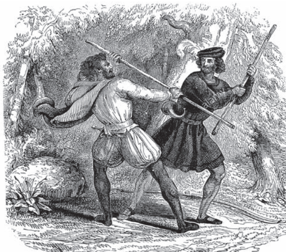
Ил. 24 К балладе «Робин Гуд и скорняк» Худ. не установлен Ок. 1845 г.