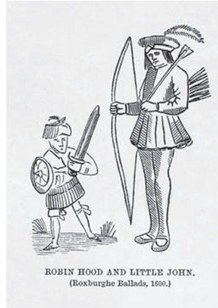
Ил. 12 Робин Гуд и Маленький Джон Худ. не установлен 1600 г.