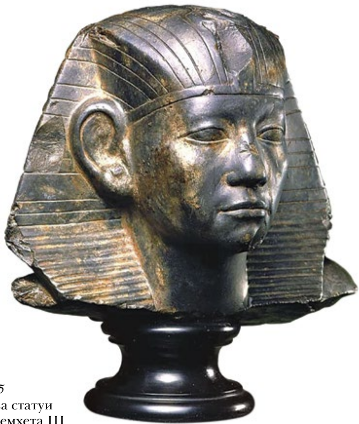
Ил. 95 Голова статуи Аменемхета III

Небольшая, с некоторыми повреждениями голова статуи из темно-зеленого ракушечного известняка представляет собой мастерски исполненный портрет последнего великого правителя Среднего царства.