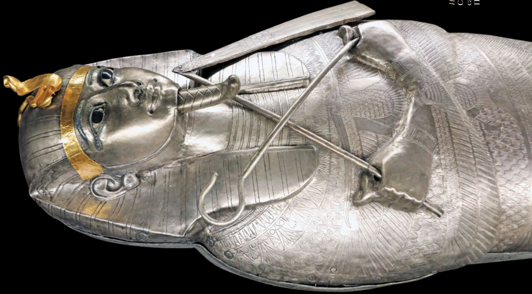
Ил. 183 Серебряный саркофаг Псусеннеса I