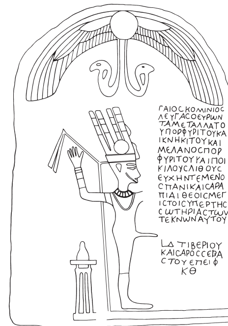
Вотивная стела с изображением Пана-Амона из святилища бога Пана в каменоломнях Монс Порфиритес, Восточная пустыня

В надписи сообщается, что Гай Коминий Левг обнаружил порфирит (а также некоторые другие породы камня), и приводится точная дата этого события — 23 июля 18 г. н. э.