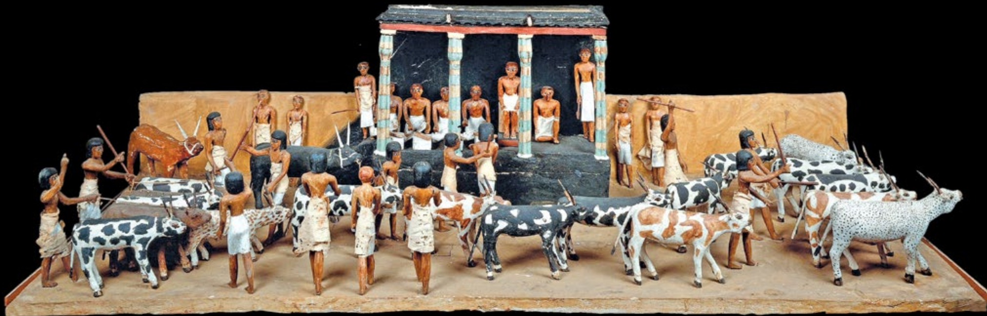
Ил. 97 Погребальная модель переписи скота. Гробница Мекетра в Фивах

Такие модели, изображавшие сцены повседневной жизни, имелись во многих гробницах эпохи Среднего царства. Перепись скота проводилась регулярно, поскольку эти данные требовались для обложения царским налогом на скот.