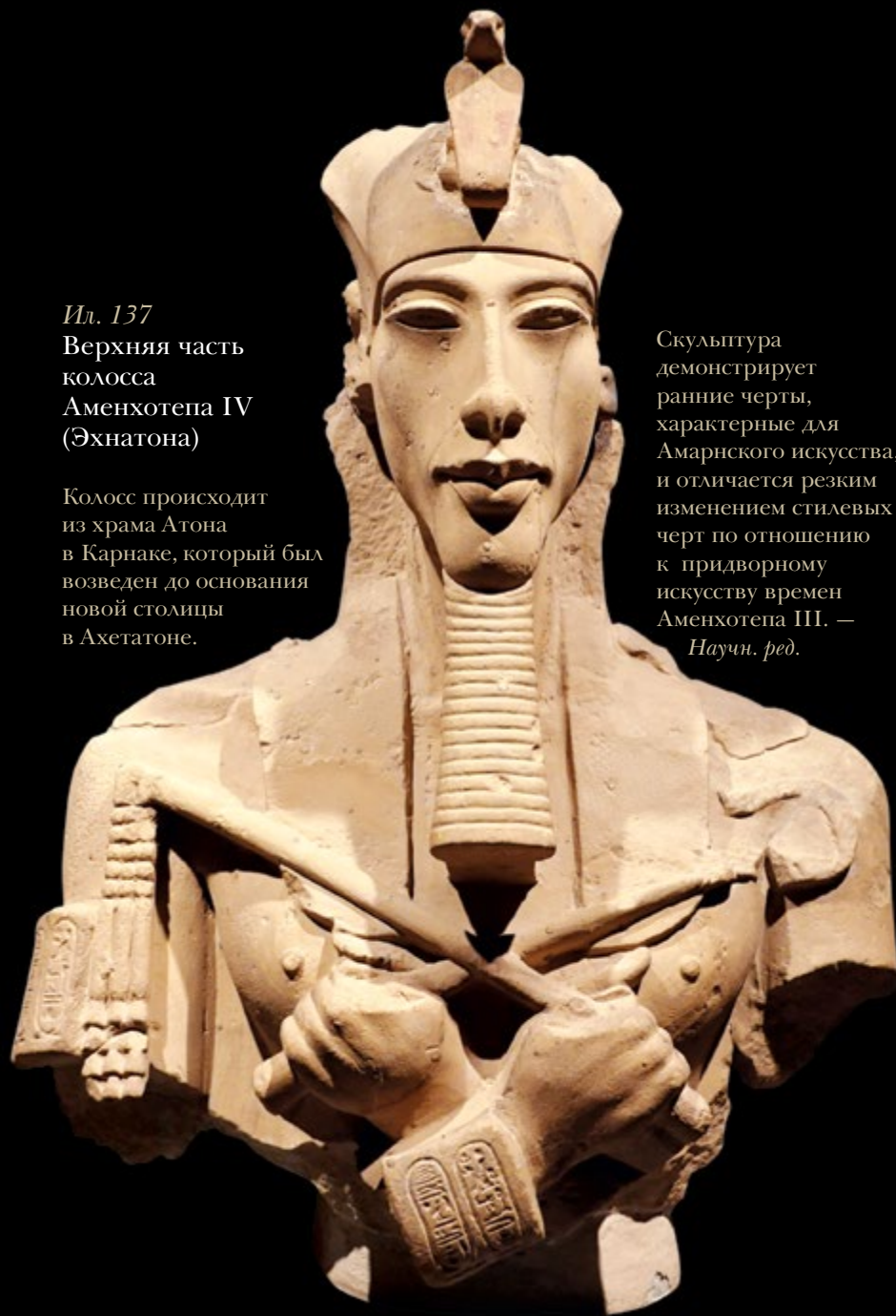
Ил. 137 Верхняя часть колосса Аменхотепа IV (Эхнатона)

Памятник был создан в Ахетатоне, в мастерской скульптора по имени Тутмос, где и был обнаружен Л. Борхардтом в 1912 году. Судя по стилистическим особенностям, памятник относится к периоду поздней Амарны, когда мастера добились удивительного баланса между чертами нового искусства, введенного Эхнатоном, и традиционной передачей скульптурной формы. Наряду с этим памятником при раскопках мастерской скульптора Тутмоса были обнаружены еще свыше пятидесяти скульптур, изображающих самого Эхнатона и его приближенных, а также гипсовые модели, которые служили основой для создания каменной скульптуры. — Научн. ред.