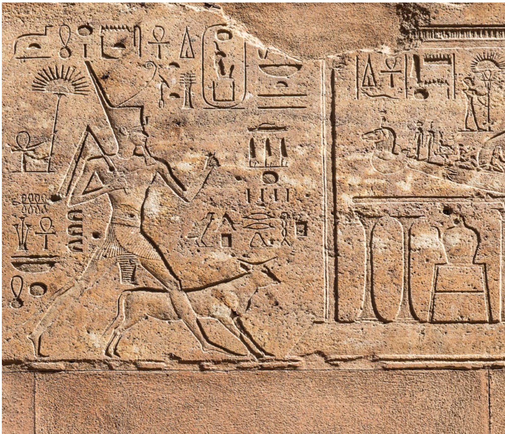
Ил. 122—123 Сцена праздника sed (царский юбилей) царицы Хатшепсут (ок. 1473— 1458 гг. до н. э.). Фрагмент рельефного декора кварцитовый («красной») часовни этой правительницы