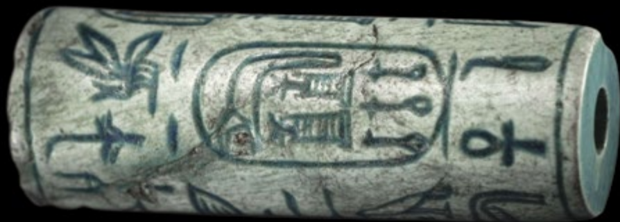
Ил. 98 Цилиндрическая печать царицы Себекнеферу (ок. 1777—1773 гг. до н. э.). Сине-зеленый фаянс

Такие модели, изображавшие сцены повседневной жизни, имелись во многих гробницах эпохи Среднего царства. Перепись скота проводилась регулярно, поскольку эти данные требовались для обложения царским налогом на скот.