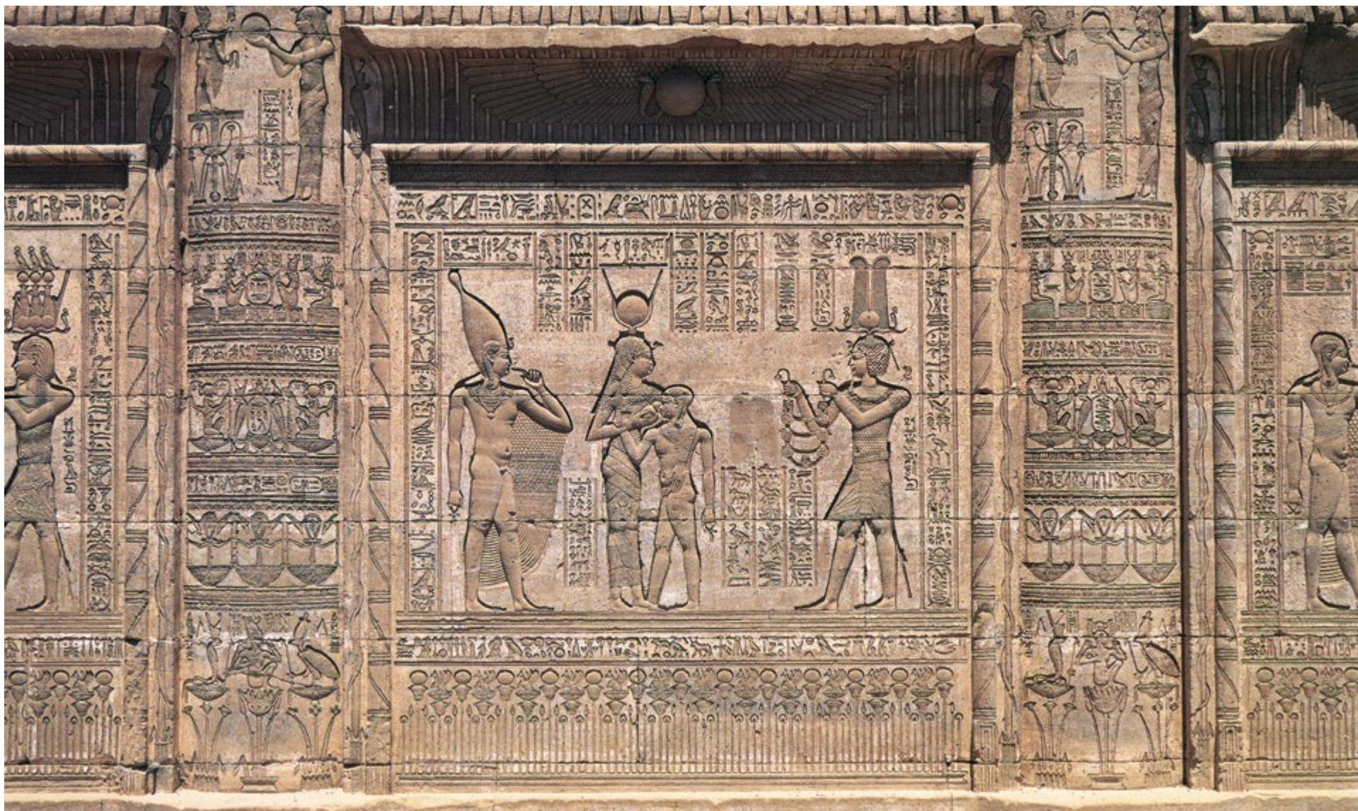
Ил. 224 Сцена почитания Ихи. Храмовый комплекс Дендера

Рельефы мамиси Римского периода в Дендера — храмовом комплексе, возведенном Августом (30 г. до н. э. — 14 г. н. э.) и декорированном при Тиберии (14—37 гг. н. э.), отличаются мастерством исполнения, обилием декоративных деталей и прекрасным состоянием сохранности.