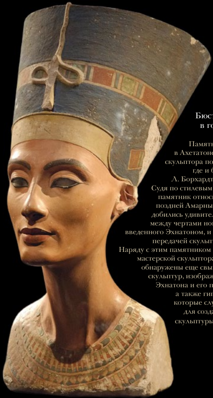
Ил. 136 Бюст Нефертити в голубой тиаре

Памятник был создан в Ахетатоне, в мастерской скульптора по имени Тутмос, где и был обнаружен Л. Борхардтом в 1912 году. Судя по стилистическим особенностям, памятник относится к периоду поздней Амарны, когда мастера добились удивительного баланса между чертами нового искусства, введенного Эхнатоном, и традиционной передачей скульптурной формы. Наряду с этим памятником при раскопках мастерской скульптора Тутмоса были обнаружены еще свыше пятидесяти скульптур, изображающих самого Эхнатона и его приближенных, а также гипсовые модели, которые служили основой для создания каменной скульптуры. — Научн. ред.