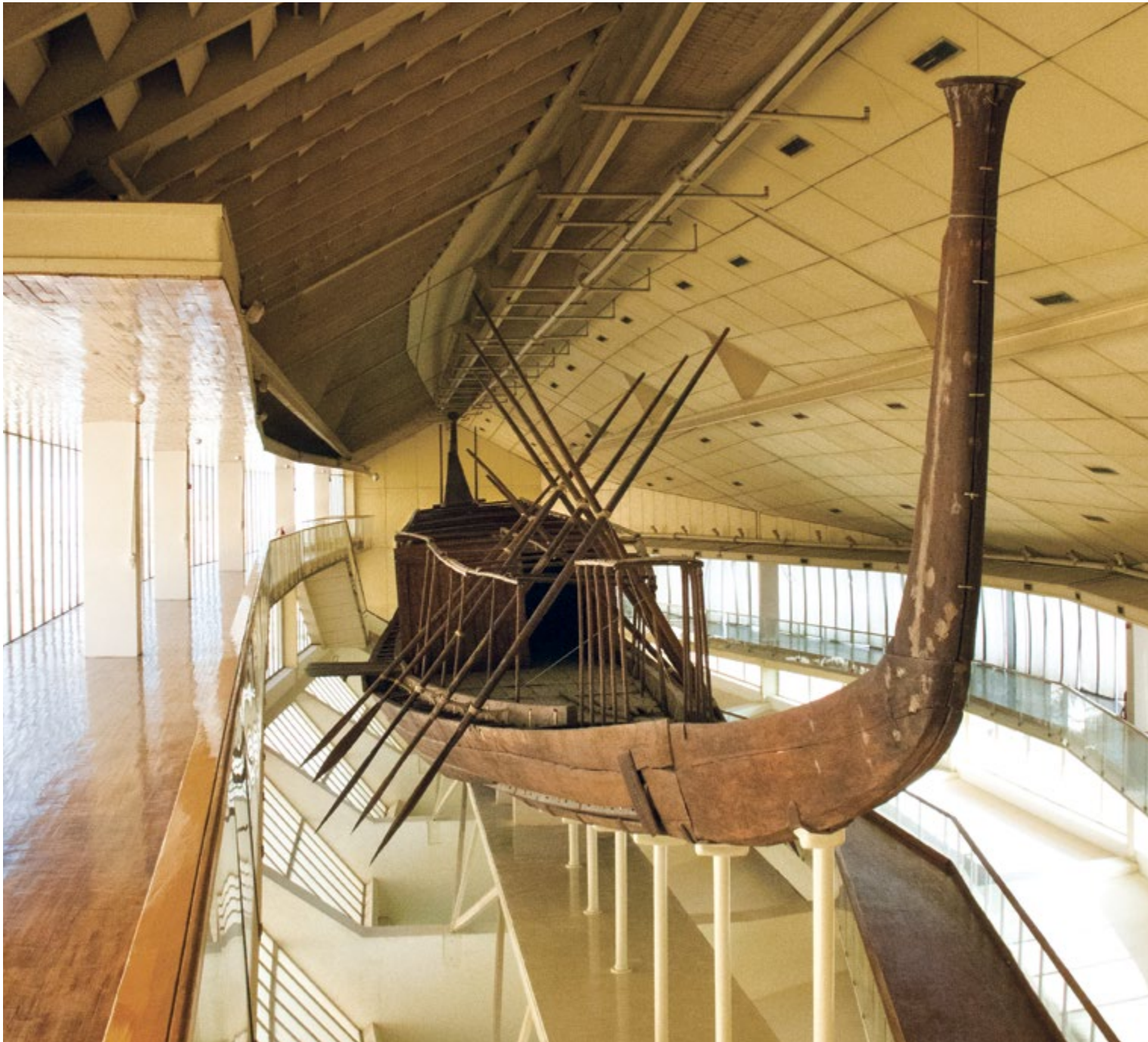
Ил. 49 Деревянная погребальная ладья Хуфу, царя IV династии

Эта огромная ладья была обнаружена в Гизе, с южной стороны от пирамиды Хуфу (Хеопса), «погребенной» в углублении, выдолбленном в каменной породе. Сохранилась ладья настолько хорошо, что ее удалось восстановить и выставить на всеобщее обозрение.