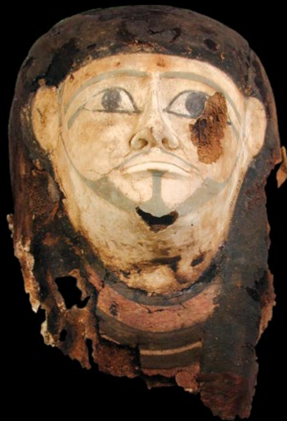
Ил. 76 Картонажная маска мумии

В Первый переходный период головы многих мумий начали покрываться раскрашенными картонажными масками, такими как данный экземпляр из могильника в Седменте.