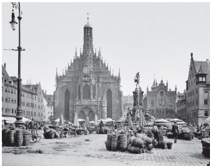
Ил. 44 Рыночная площадь. Собор Фрауенкирхе. Ок. 1900 г.