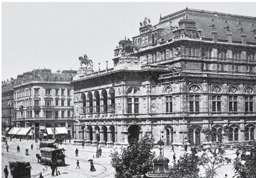
Ил. 50 Вокзал императора Франца Йозефа I. Ок. 1905 г.