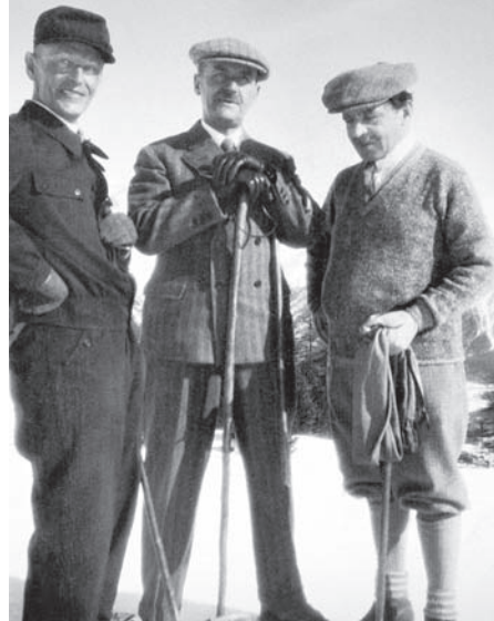
Ил. 19 Герман Гессе, Томас Манн и Якоб Вассерманн. Альпы. 1931 г.