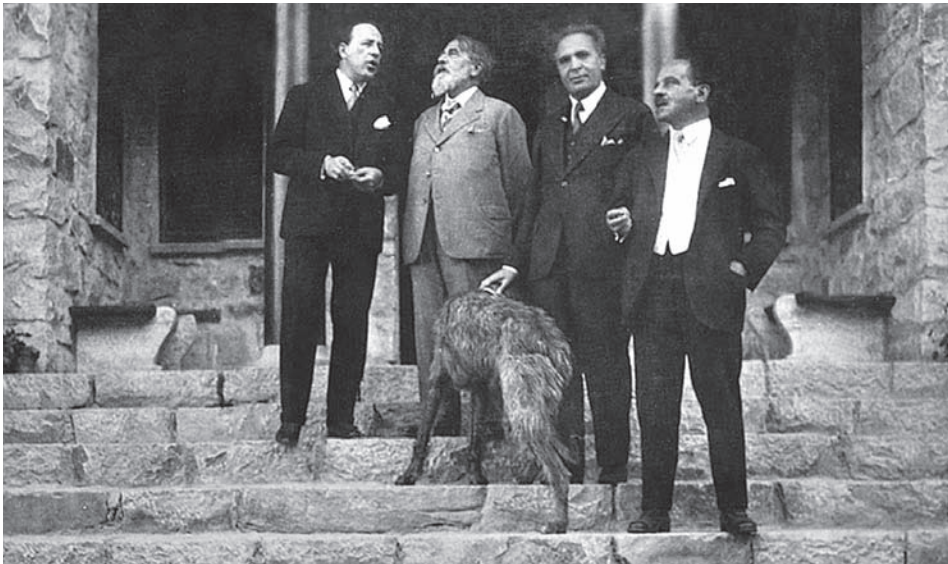
Ил. 20 Эмиль Людвиг, Артур Шницлер, Бруно Вальтер и Якоб Вассерманн на ступенях виллы «Сувреттина». Санкт-Моритц. 26 июля 1930 г.