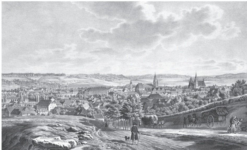
Ил. 69 Панорама Ансбаха. 1828 г. Худ. А. Хайнрих, Г.В. Краус