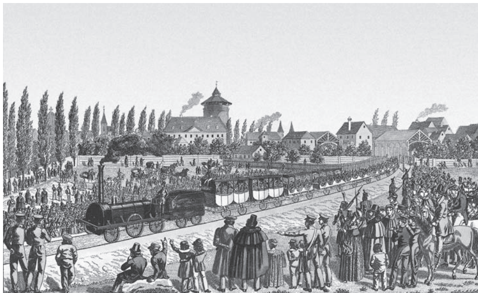
Ил. 70 Торжественное открытие железной дороги «Нюрнберг – Фюрт» 7 декабря 1835 г. Худ. Х. Марсграф