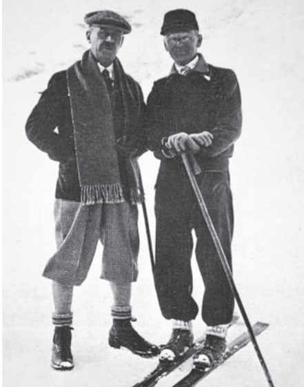
Ил. 18 Герман Гессе и Томас Манн на лыжах. Санкт-Моритц. 1929 г.