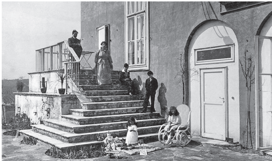
Ил. 21 Якоб Вассерманн с первой женой и детьми на своей вилле в Гринцинге. 1917 г.