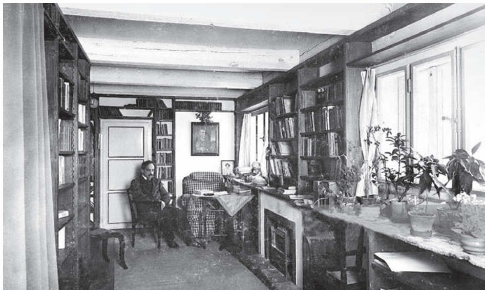
Ил. 22 Комната Якоба Вассерманна на вилле в Гринцинге. 1917 г.