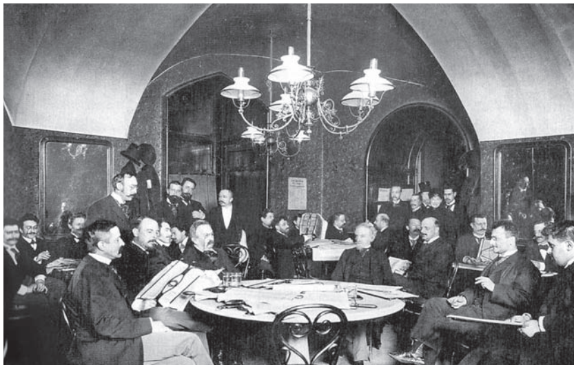
Ил. 49 Кафе «Гринштайдл». 1897 г.