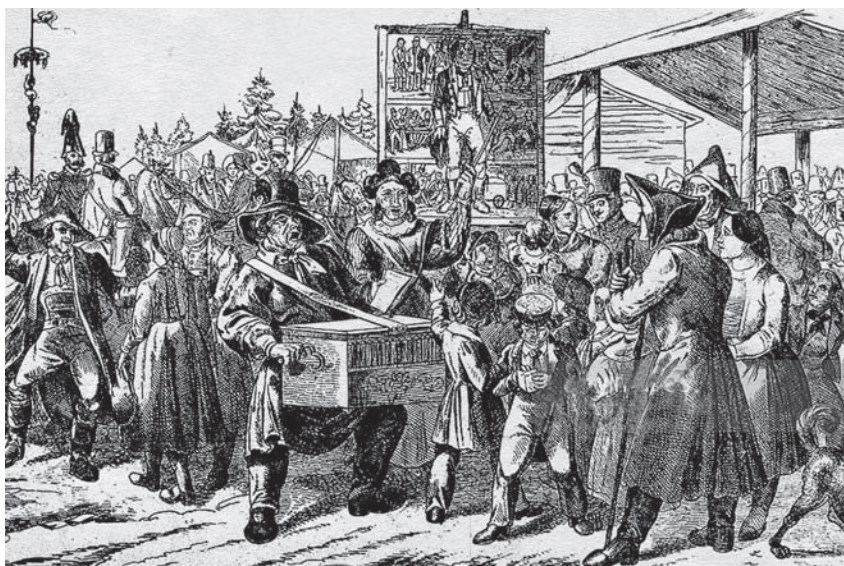
Ил. 68 Уличные шарманщики рассказывают публике нравоучительную историю Каспара Хаузера. XIX в. Худ. не установлен