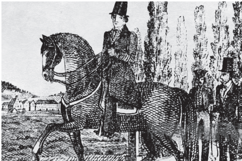
Ил. 67 Каспар Хаузер на верховой прогулке. 1829 г. Худ. не установлен