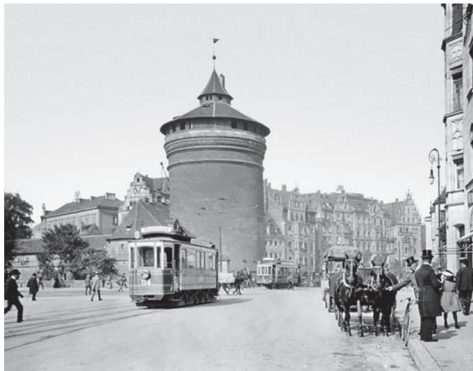
Ил. 43 Кёнигштрассе. Ок. 1900 г.